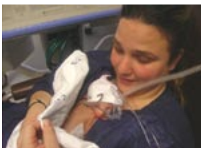
Mãe a fazer Canguru com o seu bebé ventilado

Estes dois neonatologistas confrontados com as condições precárias de trabalho em que exerciam funções, com escassez de recursos humanos e técnicos (como incubadoras) e devido ao conhecimento da sobrevivência de um recém-nascido prematuro por ser transportado junto ao peito da mãe durante 24 horas (sem utilização da incubadora), decidiram enviar os recém-nascidos precocemente para casa, com o objectivo de lhes proporcionar um contacto pele a pele constante e alimentação