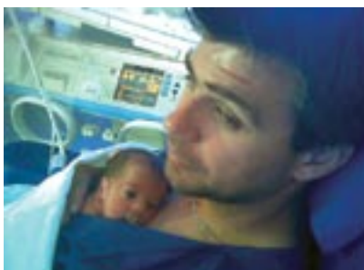
Pai a fazer Canguru

«Os pais consideram a técnica uma mais-valia, permitindo-lhes uma maior proximidade com o seu bebé e maior segurança.»