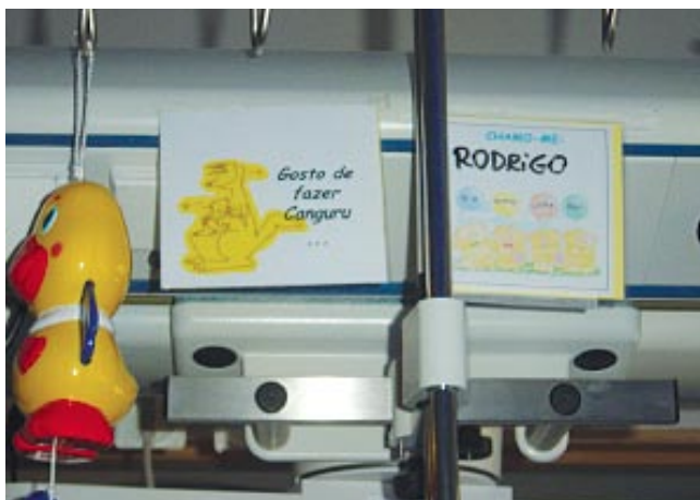
Cartão identificativo de um bebé que faz parte do estudo