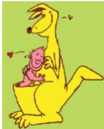
Símbolo do grupo

Após a sua implementação verificou-se que a maioria dos RN prematuros ultrapassou o peso estimado na altura da última avaliação e os bebés de idade corrigida superior a 37 semanas estiveram no limite ou ultrapassaram o aumento máximo esperado de peso na última avaliação. Outro dado positivo foi o facto de, no